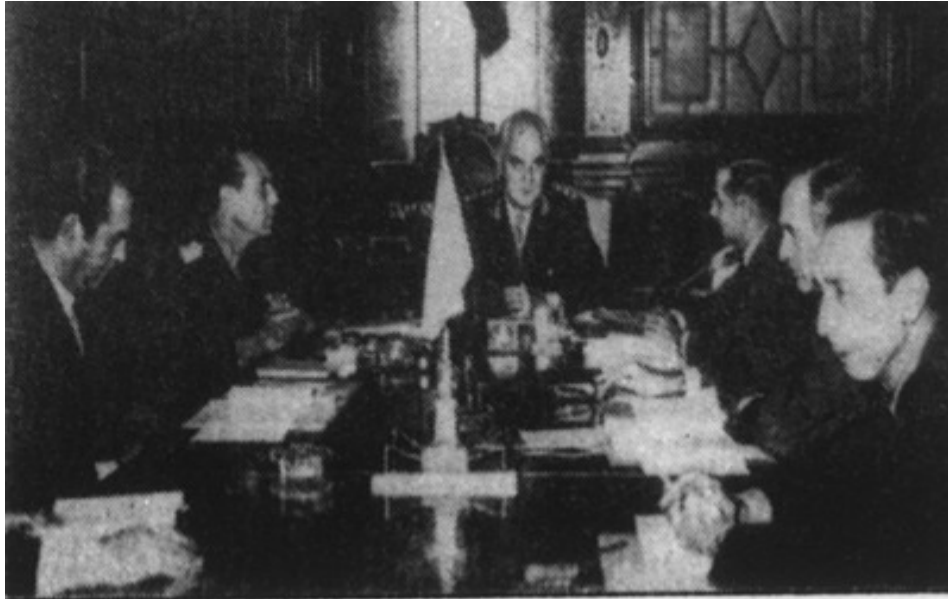
Reunión de asesinos, en esa u otra reunión se aprobó la masacre de Trelew

Alejandro Agustín Lanusse , presidente de la nación y jefe del ejército