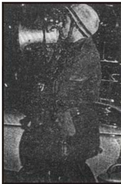
El asesino de Trelew dirigiéndose a los cros. en el aeropuerto