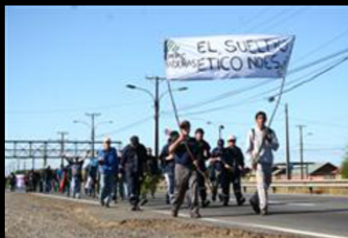
Masiva marcha de papeleros en la 160