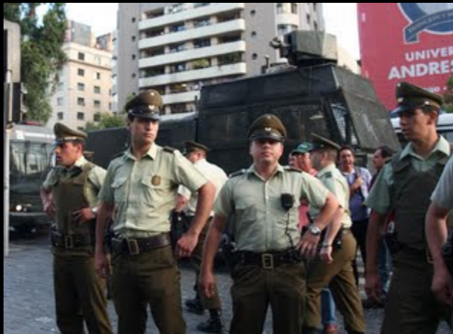
CARABINERO DESCONTROLADO, GOLPEADOR Y PATEADOR