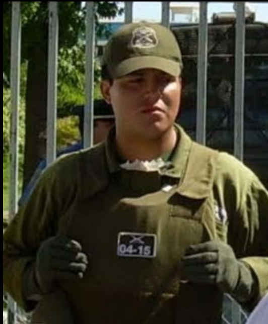
CARABINERO GOLPEADOR A MUJERES