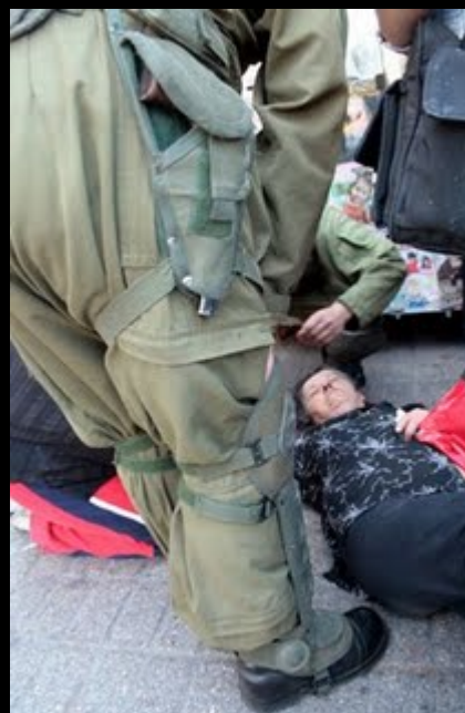
Una gran cantidad de Deudores Habitacionales concurre a La Moneda con el fin de entregar sus cartas, conteniendo sus peticiones para detener los remates de