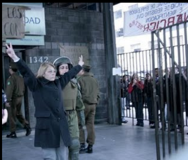
CARABINEROS INTERVINO EN OFICINAS DE EXTRANJERÍA Y SE MANTIENE FUERA DEL EDIFICIO CORPORATIVO DE CALLE CATEDRAL.