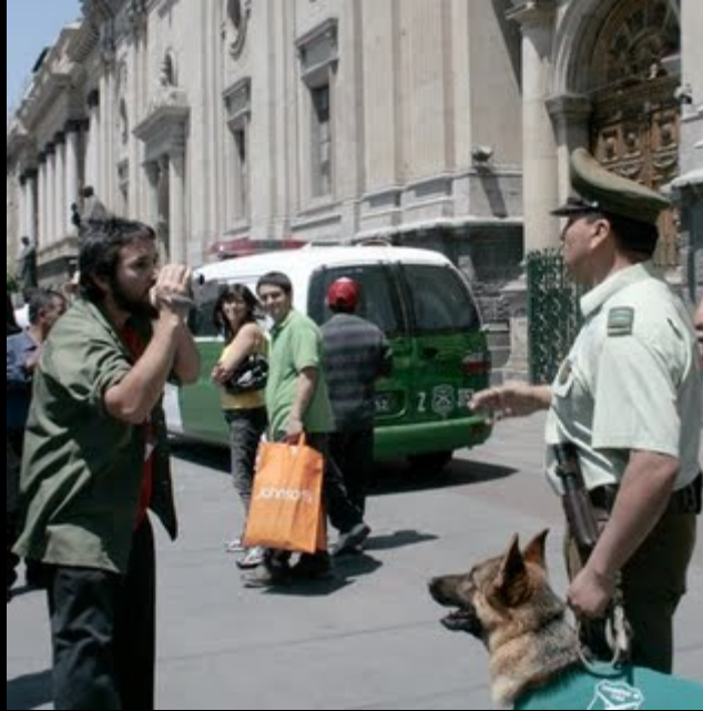
A VECES SON FF.EE. U OTRAS VECES SON LOS PERROS