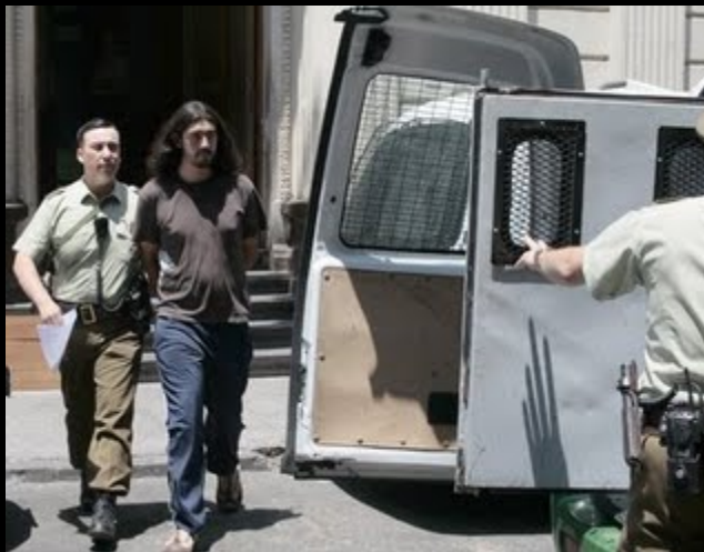
LO LLEVAN A CONSTATAR LESIONES (SON MAESTROS EN LOS MONTAJES)

Como es costumbre cuando se produce alguna acción de protesta, Carabineros y FFEE una vez más se desquitaron con la Prensa , a pesar que un uniformado se jactaba que ellos trabajaban normalmente con la prensa, otro uniformado soltó a su perro contra un gráfico acreditado quien mordió, también este animal y asustó a un niño que estaba presente en su coche. Además, otro Carabinero perteneciente a la 1º Comisaría no permitió hacer su trabajo a los gráficos de UPI y del Mercurio. A pesar de ello, el encargado del operativo dijo: "A la prensa se le deja hacer su labor, siempre estamos dispuestos a colaborar con los trabajadores de la prensa". Las imágenes demuestran otra cosa.