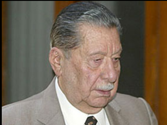
Sergio Arellano Stark "Alias el Loco"