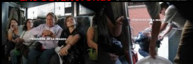
LA LLEGADA A LA TERCERA COMISARIA