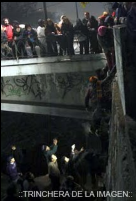
..TRINCHERA DE LA IMAGEN:.