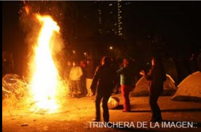
..TRINCHERA DE LA IMAGEN:.