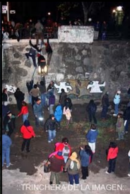
..TRINCHERA DE LA IMAGEN:.