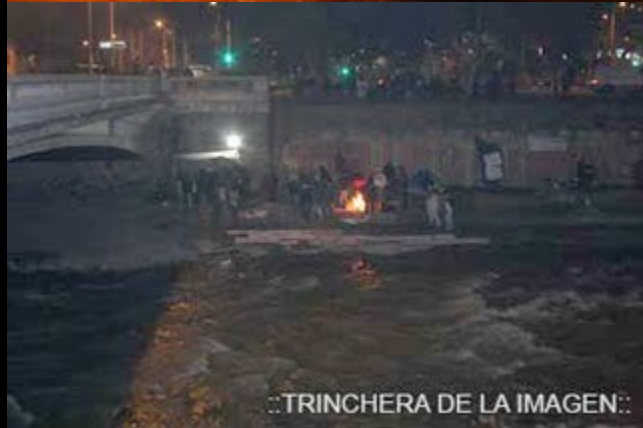
..TRINCHERA DE LA IMAGEN:.