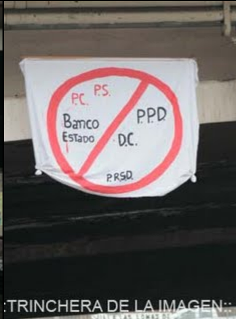
NCHERA DE LA IMAGEN::