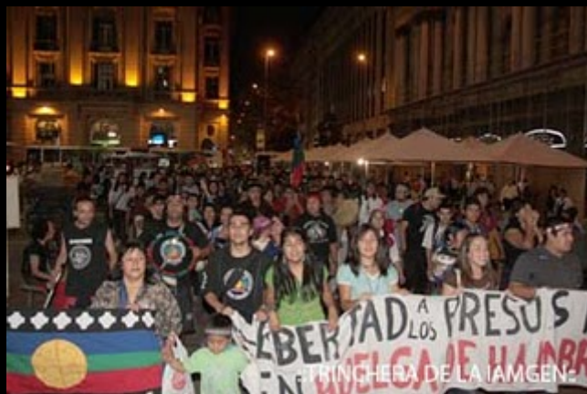
::TRINCHERA DE LA IAMGEN: