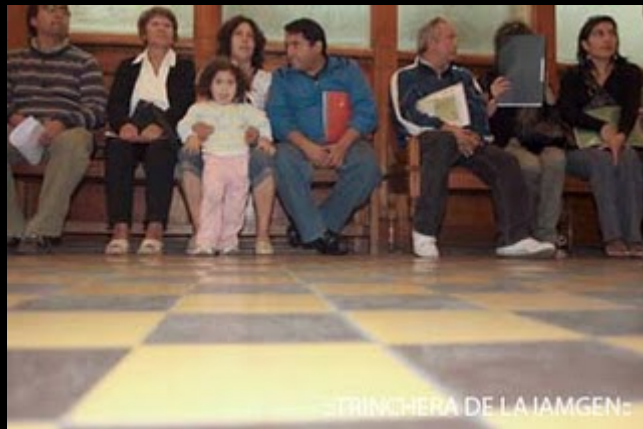
::TRINCHERA DE LA IAMGEN: