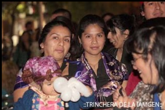
::TRINCHERA DE LA IAMGEN: