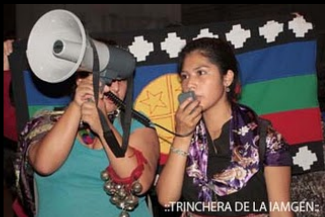
::TRINCHERA DE LA IAMGEN: