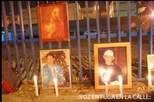
::VOZ EN FUGA EN LA CALLE::