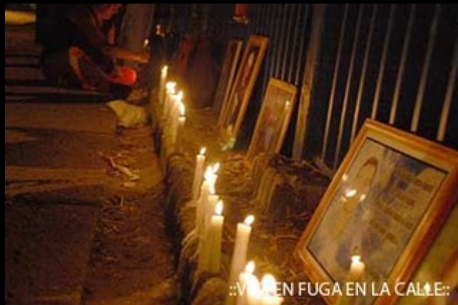
::VOZ EN FUGA EN LA CALLE::