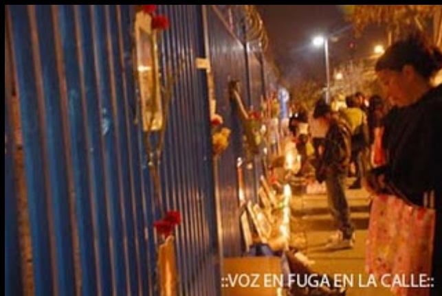
::VOZ EN FUGA EN LA CALLE::