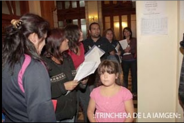
::TRINCHERA DE LA IAMGEN: