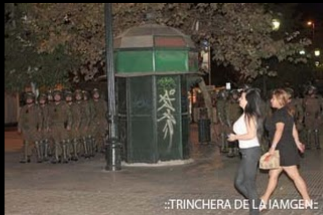
::TRINCHERA DE LA IAMGEN: