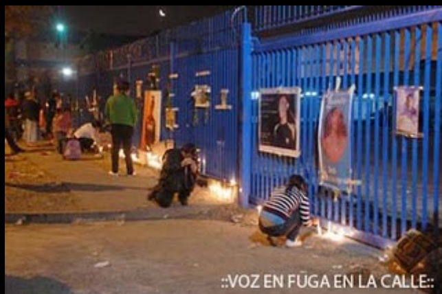
::VOZ EN FUGA EN LA CALLE::