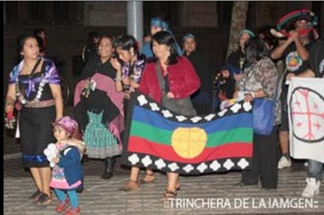
::TRINCHERA DE LA IAMGEN: