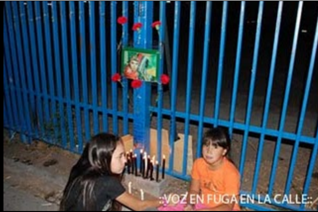
::VOZ EN FUGA EN LA CALLE::