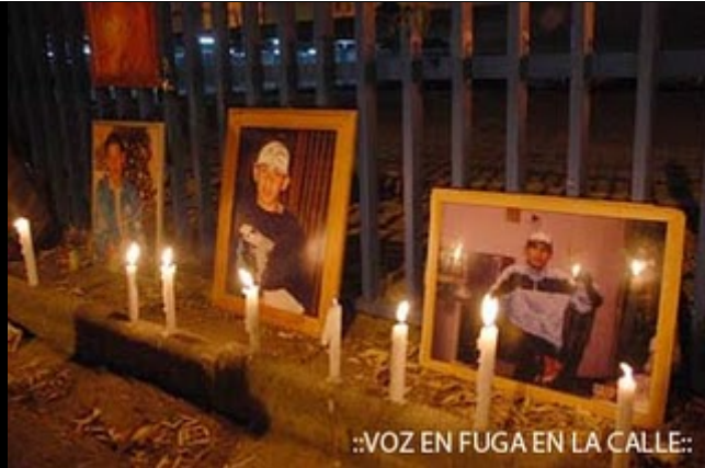
::VOZ EN FUGA EN LA CALLE::