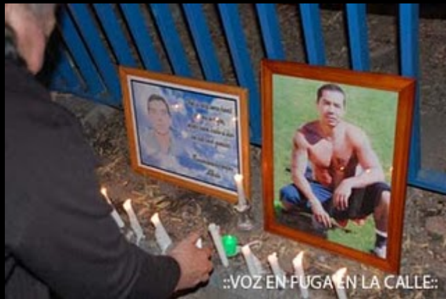
::VOZ EN FUGA EN LA CALLE::