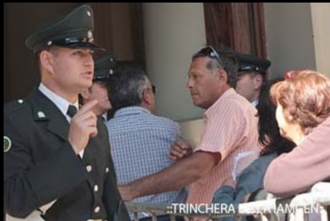
::TRINCHERA DE LA IAMGEN: