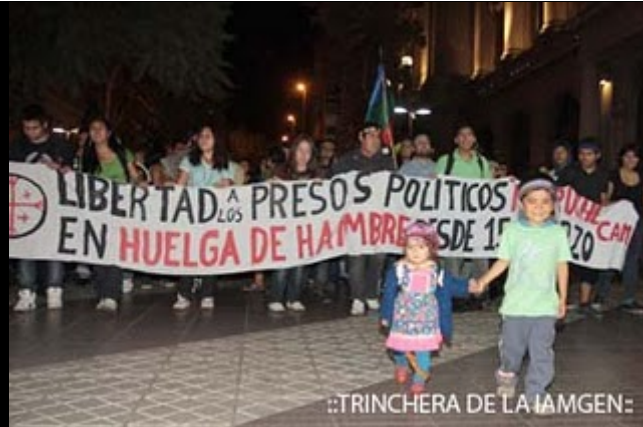
::TRINCHERA DE LA IAMGEN: