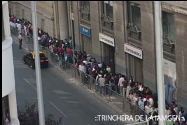
::TRINCHERA DE LA IAMGEN: