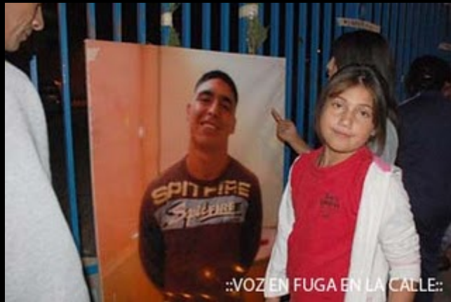
::VOZ EN FUGA EN LA CALLE::