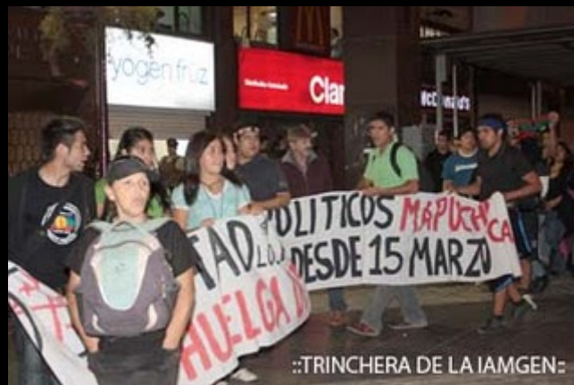
::TRINCHERA DE LA IAMGEN:

Aproximadamente un centenar de simpatizantes de la causa Mapuche marcharon por el centro de Santiago, para solicitar la Libertad de los presos políticos Mapuche en Huelga de Hambre, demandando un juicio justo sin la aplicación de la Ley antiterrorista, sin usar los famosos, cobardes y siniestros testigos sin rostro, esperando ser escuchados y que de una vez por todas se haga justicia transparente. El recorrido se realizó sin incidentes ni detenidos, a pesar del fuerte despliegue policial que se apostó en el lugar.