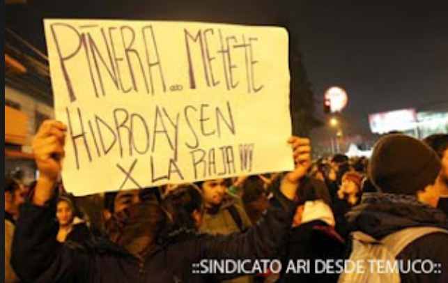
::SINDICATO ARI DESDE TEMUCO:.