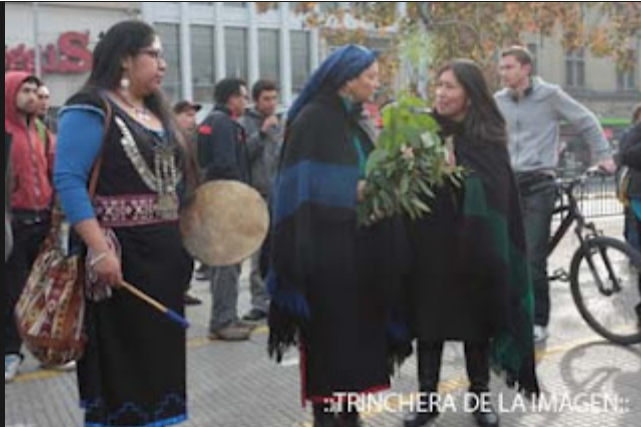
::TRINCHERA DE LA IMAGEN::