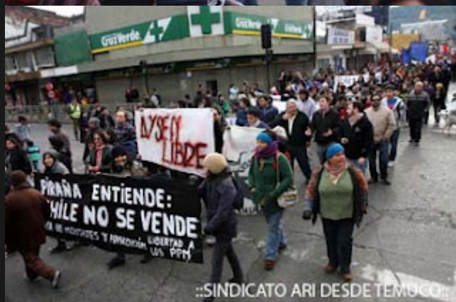
::SINDICATO ARI DESDE TEMUCO::