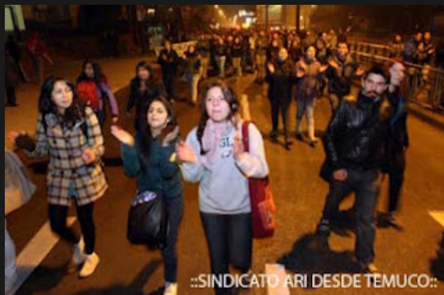
::SINDICATO ARI DESDE TEMUCO:.