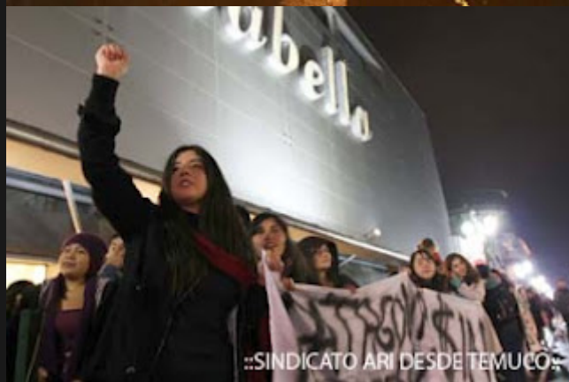
::SINDICATO ARI DESDE TEMUCO::