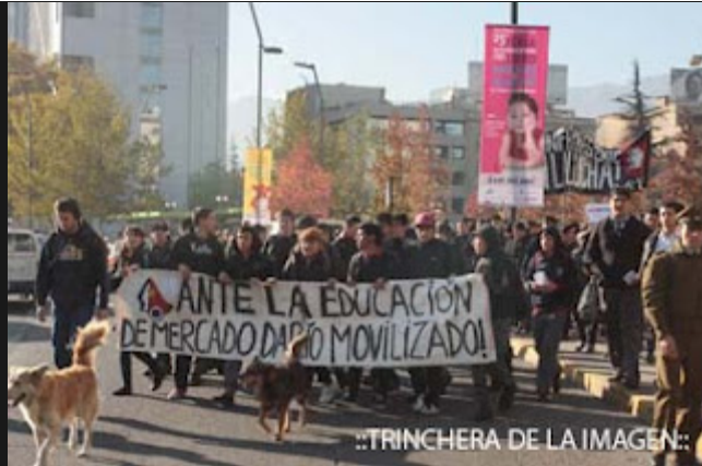
..TRINCHERA DE LA IMAGEN: