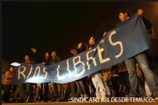
::SINDICATO ARI DESDE TEMUCO::