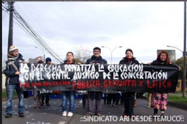
::SINDICATO ARI DESDE TEMUCO::