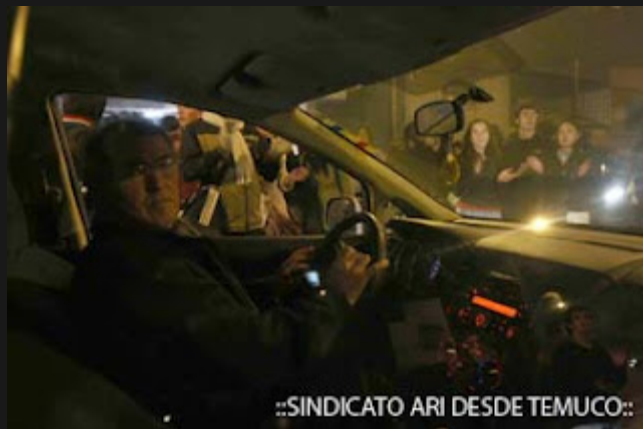
::SINDICATO ARI DESDE TEMUCO::