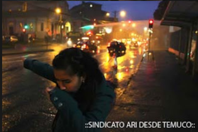
::SINDICATO ARI DESDE TEMUCO::