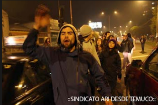
::SINDICATO ARI DESDE TEMUCO::