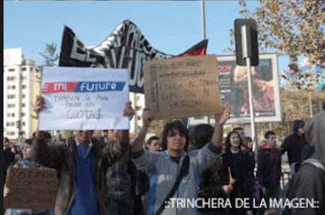
..TRINCHERA DE LA IMAGEN: