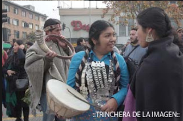
::TRINCHERA DE LA IMAGEN::