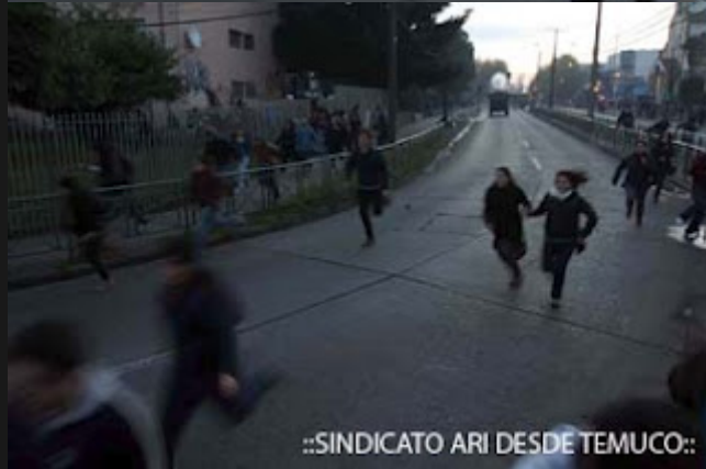
::SINDICATO ARI DESDE TEMUCO::