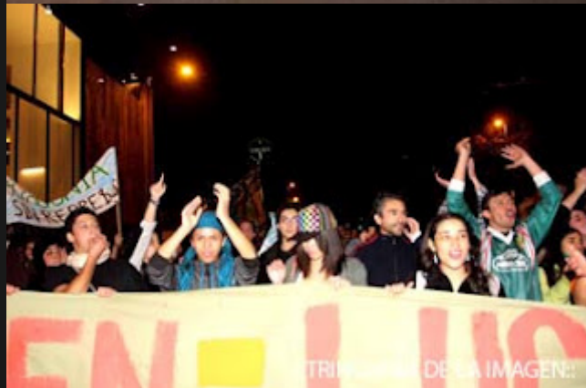
Ciudadanos auto-convocados llamaron, a través de las redes sociales Facebook y Twitter, a movilizarse este viernes por la tarde en contra del plan HidroAysén. Más de 30 mil ciudadanos llegaron hasta Plaza Italia. A la par, el gobierno sigue halagando