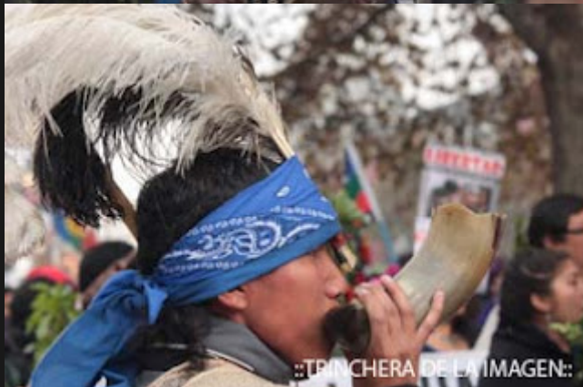
::TRINCHERA DE LA IMAGEN::