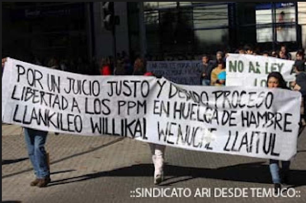
..SINDICATO ARI DESDE TEMUCO..