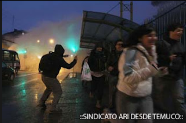
::SINDICATO ARI DESDE TEMUCO::