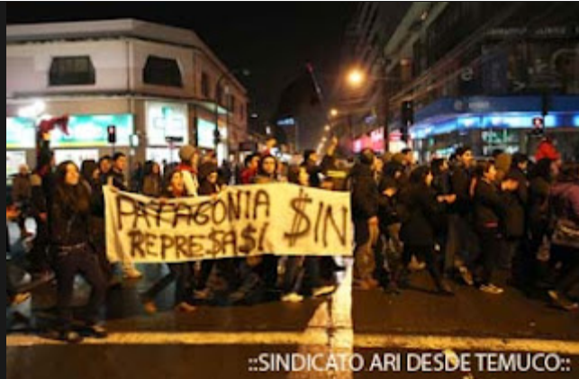
::SINDICATO ARI DESDE TEMUCO::