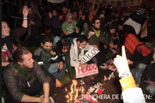
::TRINCHERA DE LA IMAGEN::