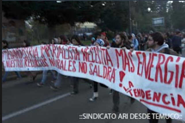
::SINDICATO ARI DESDE TEMUCO::