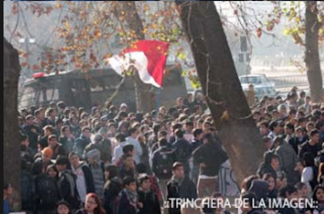
..TRINCHERA DE LA IMAGEN: