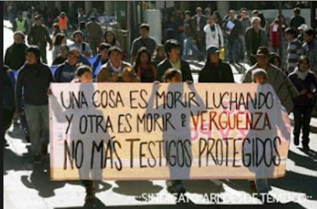
..SINDICATO ARI DESDE TEMUCO..