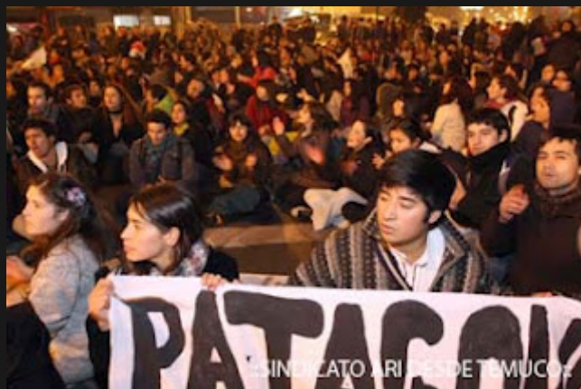
..SINDICATO ARI DESDE TEMUCO:.