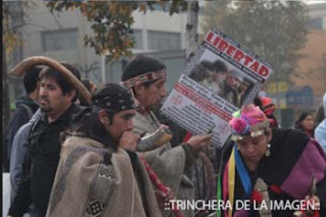
::TRINCHERA DE LA IMAGEN::