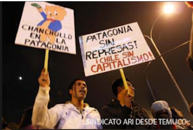
..SINDICATO ARI DESDE TEMUCO:.