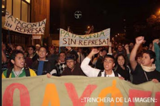
::TRINCHERA DE LA IMAGEN::

las virtudes del proyecto y sacó a más de medio millar de policías a las calles. También hubo protestas en Valparaíso, Temuco, Chillán, Los Ángeles y Valdivia. Más de 30 mil personas llegaron a Plaza Italia, en el centro de Santiago, para manifestar su rechazo al proyecto HidroAysén. El conteo corresponde a las cifras entregadas por la propia policía uniformada, la que, nuevamente, reprimió con violencia a los manifestantes.