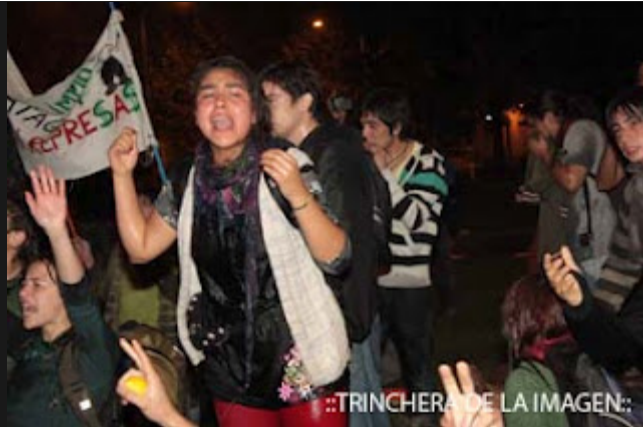
::TRINCHERA DE LA IMAGEN::