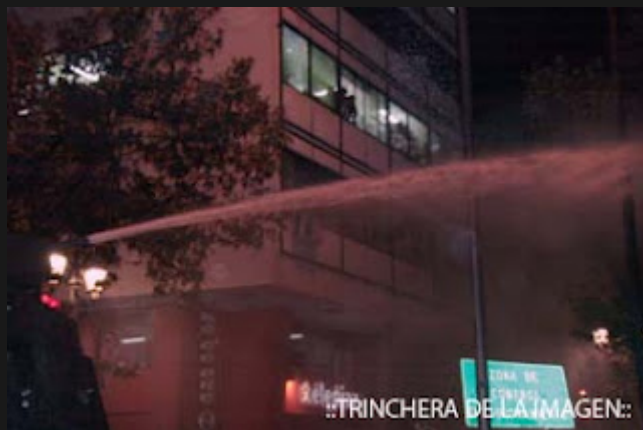
::TRINCHERA DE LA IMAGEN::