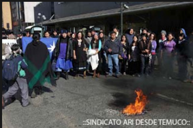
..SINDICATO ARI DESDE TEMUCO..