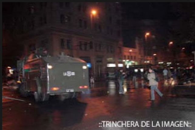
::TRINCHERA DE LA IMAGEN::