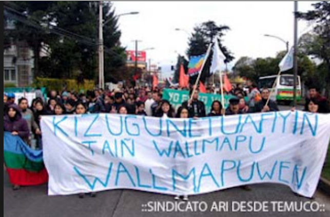
::SINDICATO ARI DESDE TEMUCO::