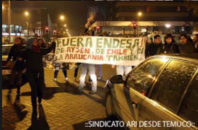
::SINDICATO ARI DESDE TEMUCO::