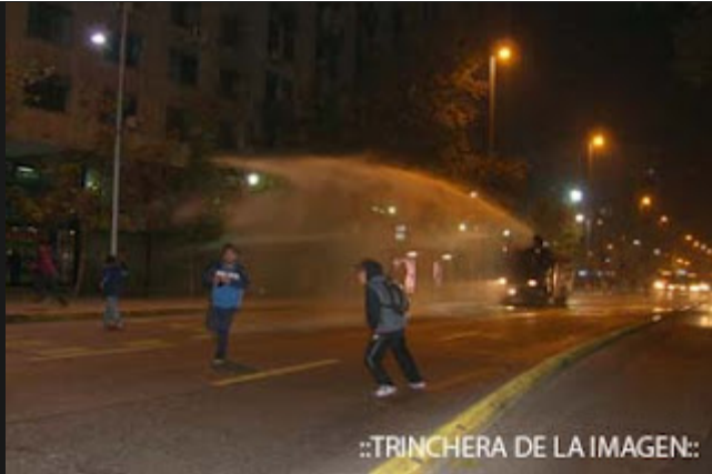
::TRINCHERA DE LA IMAGEN::