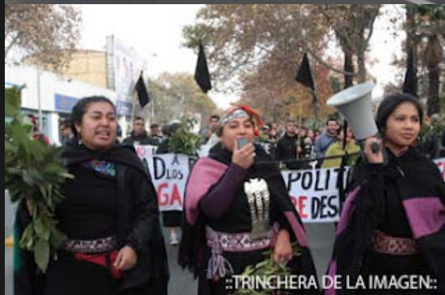
::TRINCHERA DE LA IMAGEN::