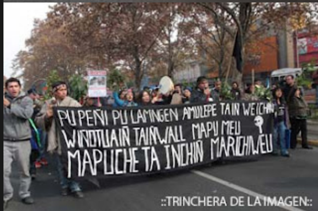
::TRINCHERA DE LA IMAGEN::