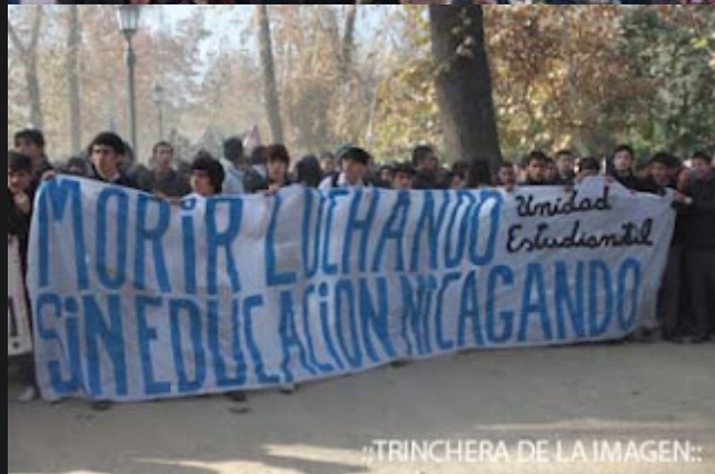
..TRINCHERA DE LA IMAGEN: