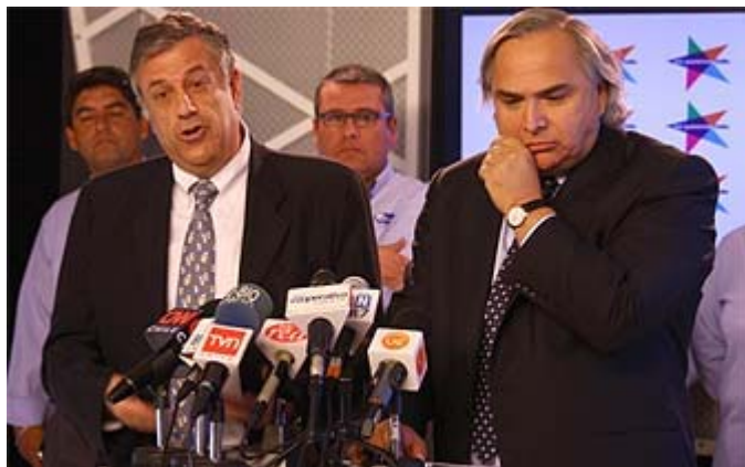
Andrés Chadwick y Jorge Schaulsohn

intentaron explicar la inconsistencia de los testimonios acusadores.