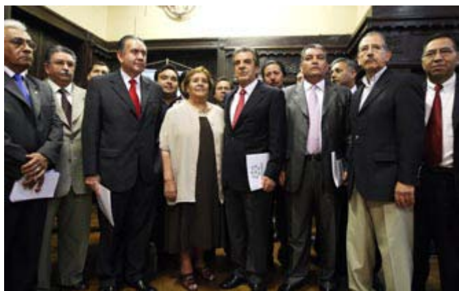
Eduardo Frei tuvo un encuentro con el obispo Emiliano Soto.

El candidato presidencial de la Concertación, Eduardo Frei , se reunió con la Mesa Ampliada de Iglesias Evangélicas , compuesta por más de 100 obispos y pastores, y les presentó 14 compromisos con este sector.