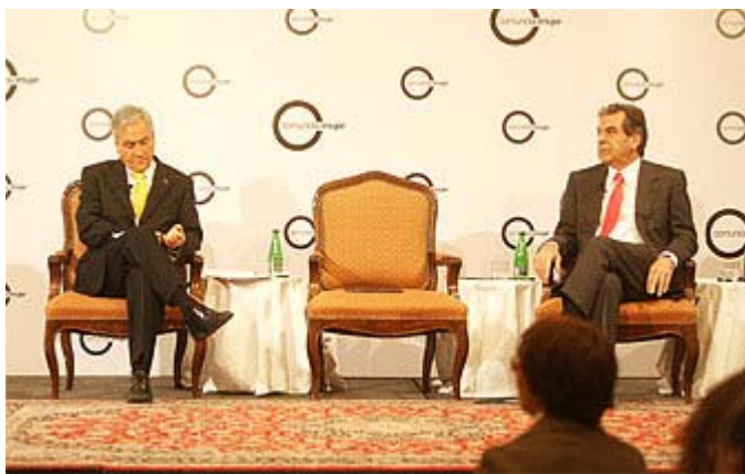
Piñera lleva dos días exigiéndole disculpas a Frei porque revivió caso de compras de acciones en Lan que al candidato de la derecha le costó dura multa.

Fuerte fue la reacción de personeros de la Concertación frente a la posición de la derecha de relativizar o desacreditar el documento de Transparencia Internacional donde se señala el caso de compras de acciones de Lan que hizo Sebastián Piñera y que le arrojó millonarias ganancias, operación cuestionada y que le costó pagar una fuerte multa decretada por la Superintendencia de Valores y Seguros.