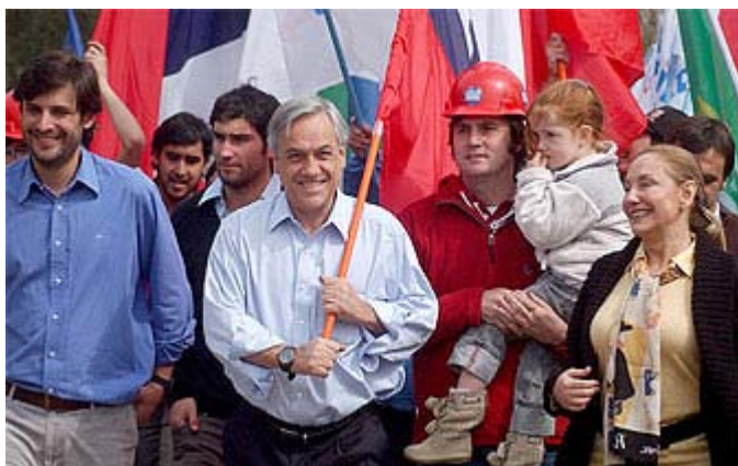
El candidato de derecha Sebastián Piñera aseguró que empresa seguirá siendo estatal, pero promete fuerte modernización.

“De Codelco no voy a hablar”, dijo rotundo el candidato presidencial de la Coalición por el Cambio, Sebastián Piñera, tras conceder una entrevista radial en Calama, donde reiteró su compromiso de no privatizar la empresa cuprera estatal.