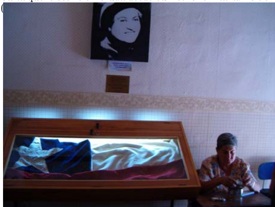
La bandera que cubrió el feretro de la premio Nobel y al lado la responsable del museo y que conoció a la poetisa en su visita a Monte Grande en 1954