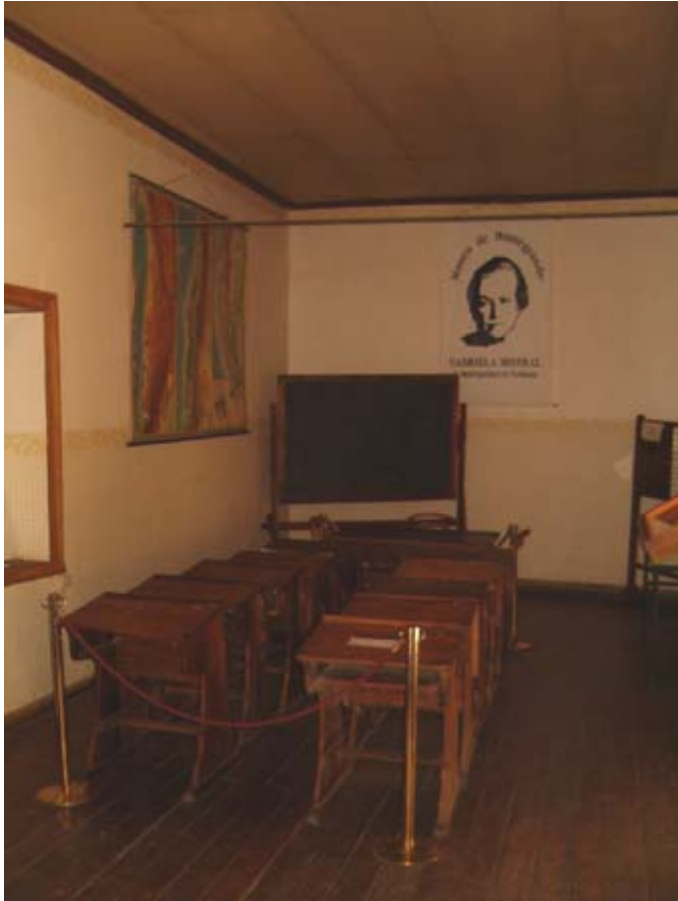
Salón de su casa donde fue maestra