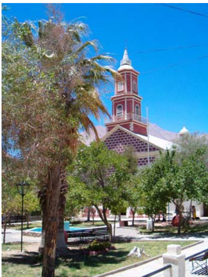
La plaza principal de Monte Grande