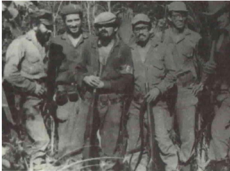
Camilo ( segundo a la izquierda ) con "Pelé", Pedro Vargas ( en el centro ). Manuel y Fabio Vásquez están a la derecha (foto inédita ).