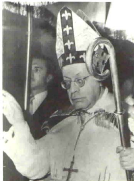
El cardenal Luis Concha Córdoba.

arquidiócesis una pastoral condenando las doctrinas del "señor Camilo Torres... quien, por haber renunciado al ejercicio del sacerdocio, ha perdido la categoría y los derechos de los clérigos y que, por tanto, las autoridades y los fieles deben considerarlo y tratarlo como a un simple ciudadano". La Iglesia bendecía por anticipado el tratamiento que guardaba el gobernador para el turbulento exsacerdote, en caso de que éste apareciera.