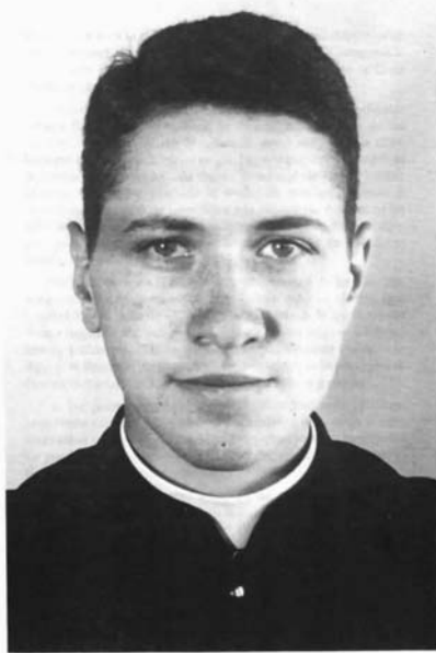
En el seminario: 1948 - 1954.

Camilo prestaba tan poca atención a las reacciones de los demás que apenas una vez en esas primeras semanas se dio cuenta de que había causado conmoción. Fue el día en que un convertible rojo paró a la puerta del seminario con un escándalo de frenos y una voz gritó: "¡Hola! ¿Aquí vive el cura Camilo?". Del auto se derramó una manada de universitarios alborotados muertos de risa al ver a Camilo envuelto hasta los tobillos en faldas negras.