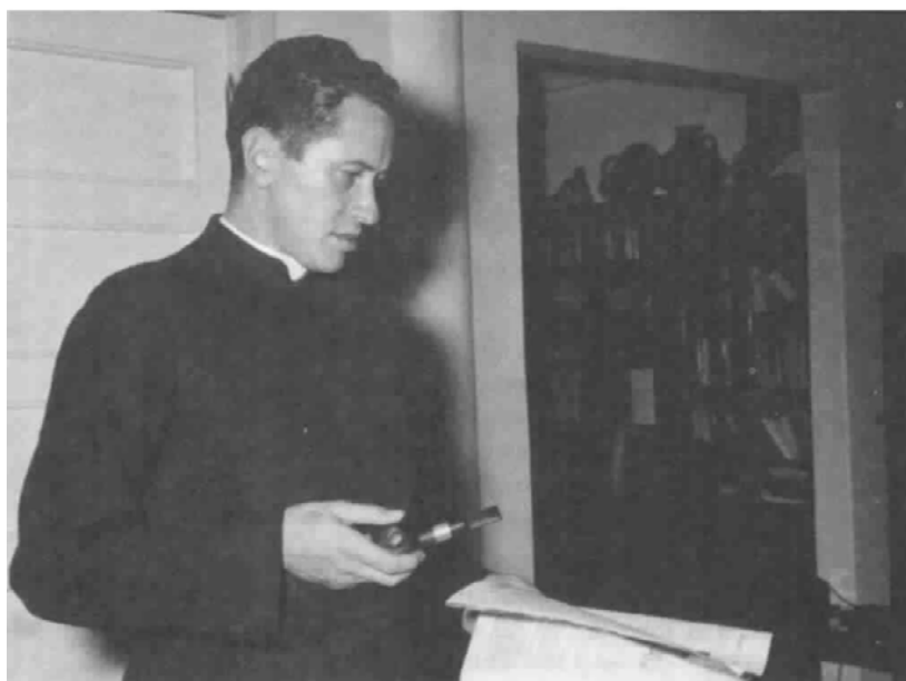
Sacerdote, decano y profesor: la época de la Universidad Nacional y la Escuela Superior de Administración Pública.