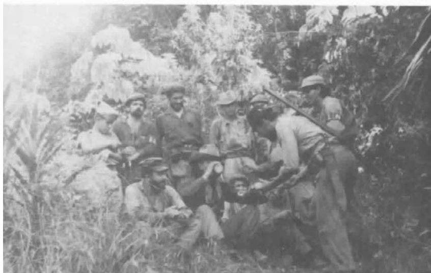
Con el grupo guerrillero ( foto inédita ).

Un par de meses resultó ser tiempo más que suficiente para que Camilo se probara. Y también para que el Frente Unido se desintegrara. Para cuando