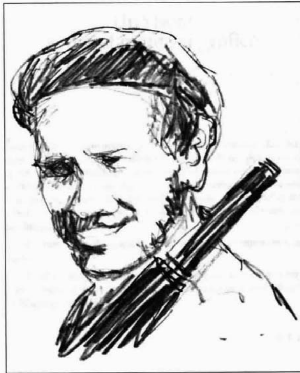
Camilo Torres en la guerrilla. (Dibujo del autor).