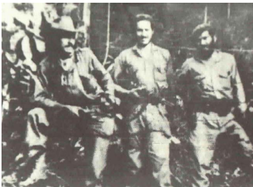
La foto que se publicó en la prensa con la Proclama de Camilo, enero de 1966.