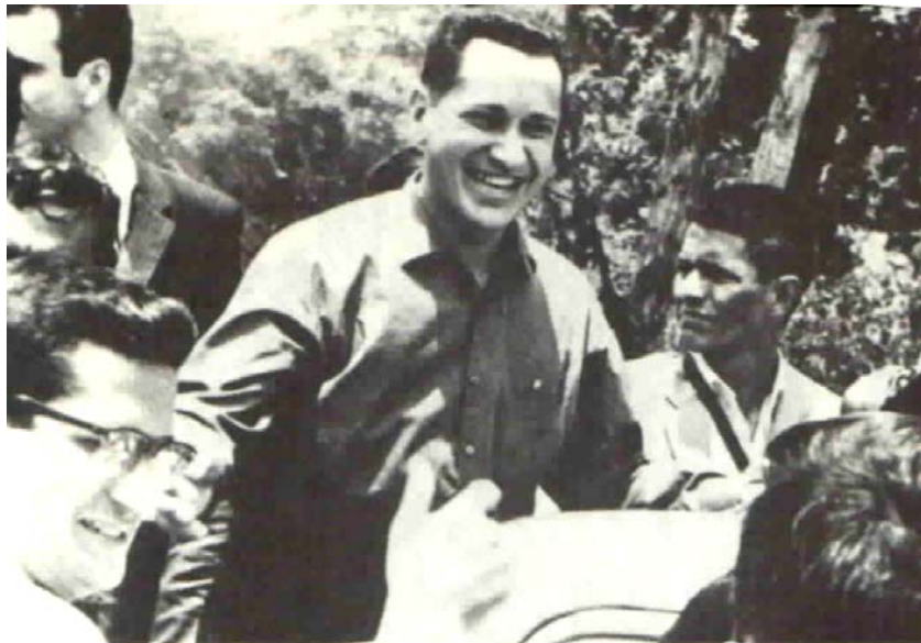
En campaña política del Frente Unido, 1965.