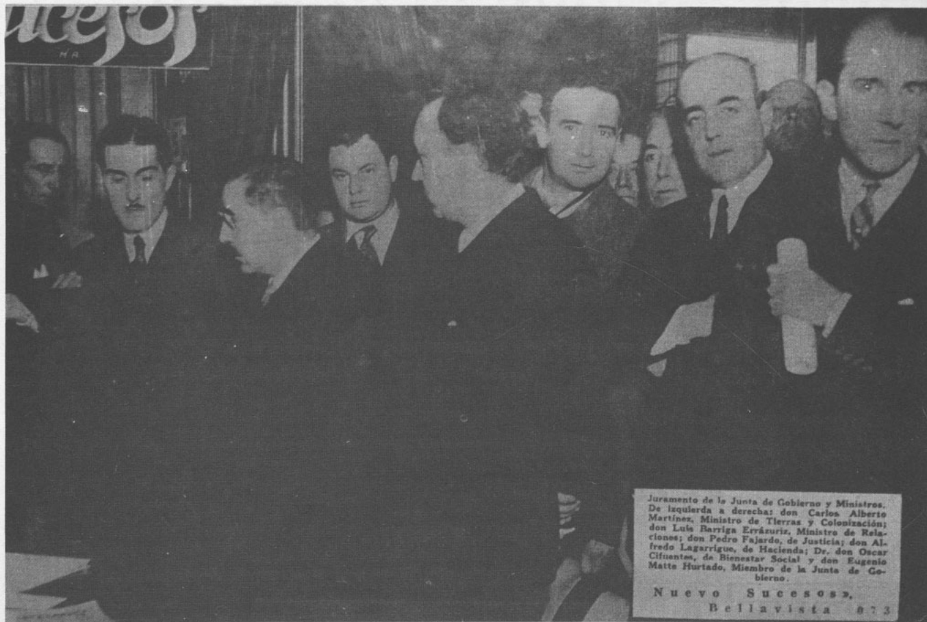
Juramento de la junta de gobierno y ministros, durante la instalación de la efímera República Socialista del 4 de junio de 1932.