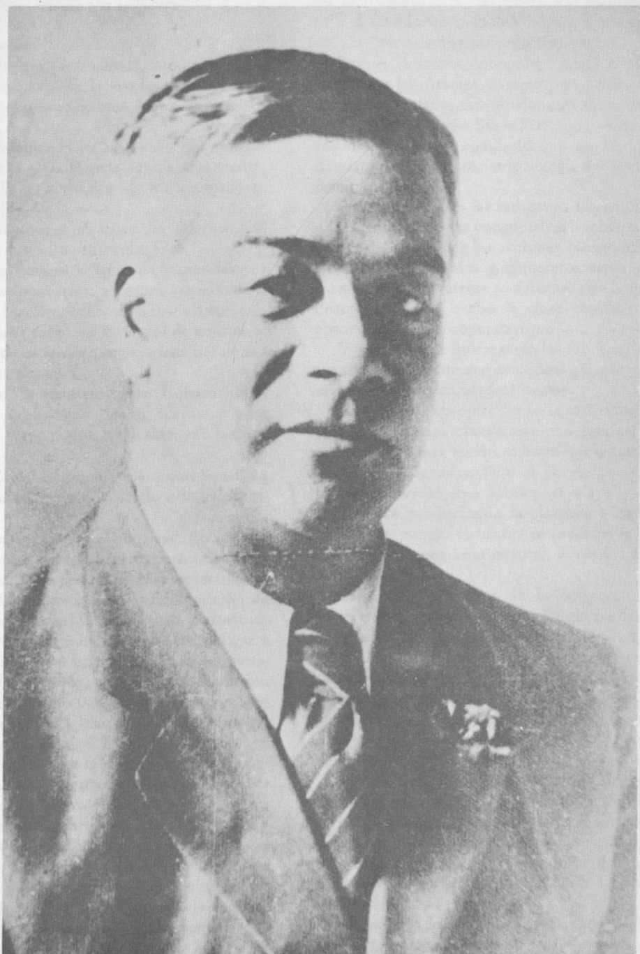
Luis Emilio Recabarren