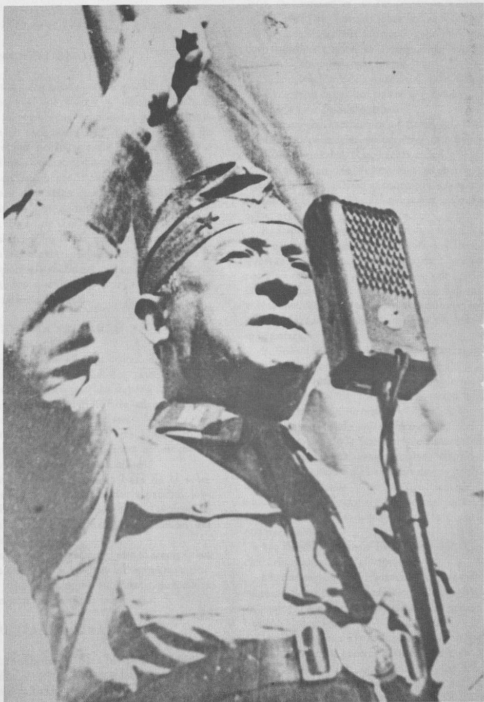
Marmaduke Grove Vallejos