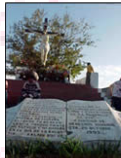
Junto al Cristo de San Isidro -a pocos metros de donde se perpetró una masacre- Quillota recuerda al Padre Llidó con este mensaje inscrito en un libro de mármol.