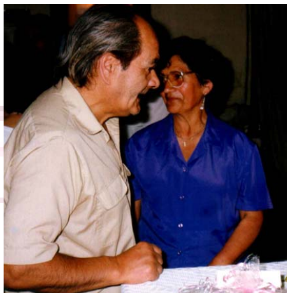
Padres de Aracely