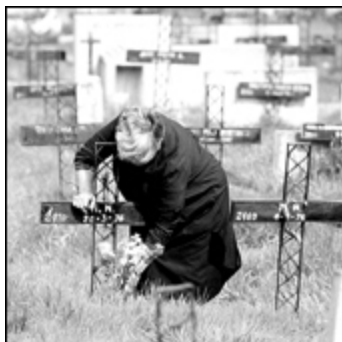
Muchos desaparecidos fueron inhumados ilegalmente en el patio 29 del Cementario General

En una reunión entre familiares y especialistas, el magistrado informó que los errores se intentan subsanar, pero que el organismo tiene dificultades técnicas.