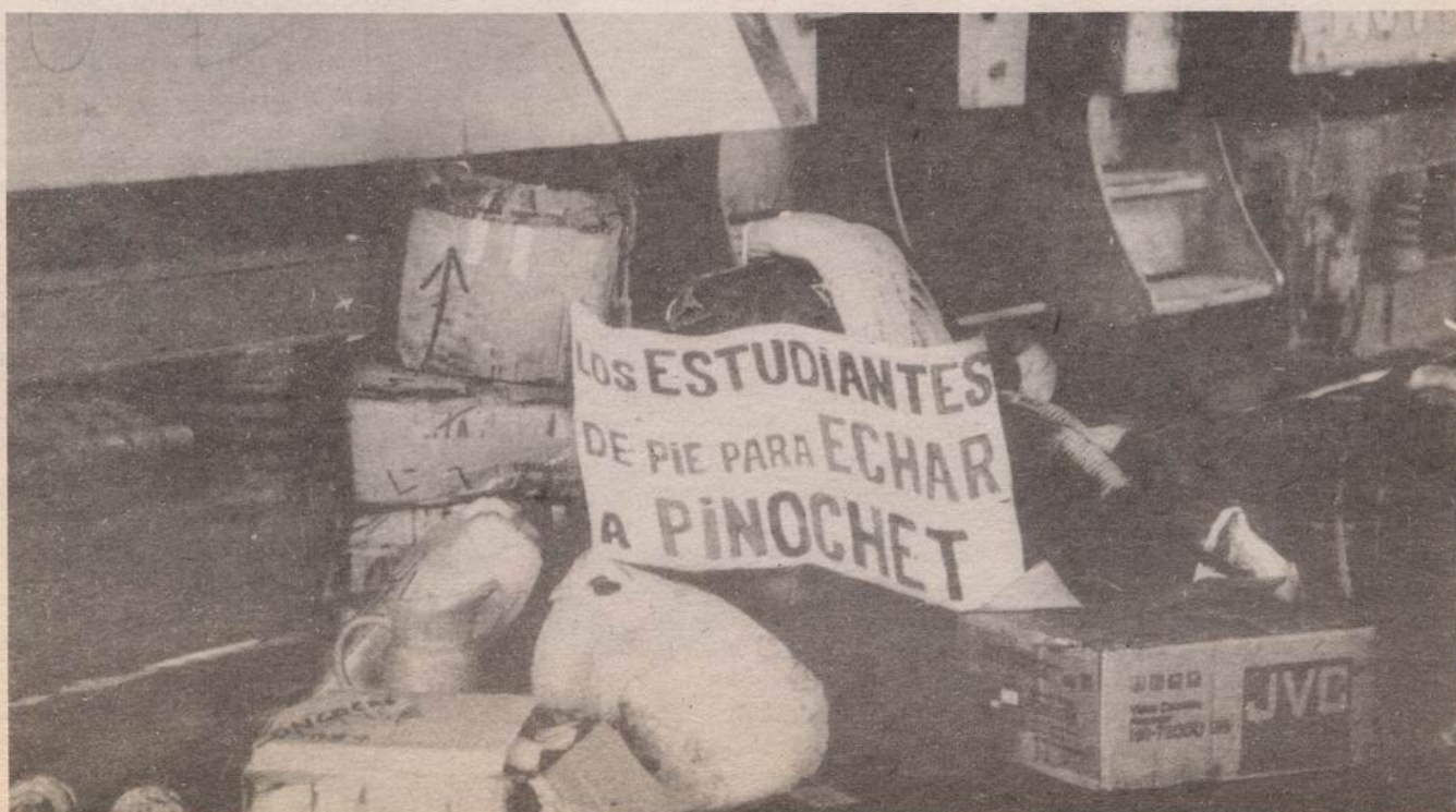
LA FUERZA DEL PUEBLO ECHO A LOS DICTADORES DUVALIER Y MARCOS