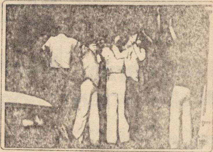
Manifestantes en la puerta de la Catedral con sus rostros cubiertos para evitar ser identificados por la represión.

CON EL FIN DE ELEVAR CUALITATIVAMENTE LOS NIVELES DE COMBATIVIDAD DE LA RESISTENCIA Y MOSTRAR LOS CAMINOS DE COMBATE DE LAS LUCHAS POPULARES, EL COMANDO ANSELMO RADRIGÁN DEL MIR COPÓ MILITARMENTE UN MICROBÚS DE RECORRIDO Y SE DIRIGIÓ A LOS OCUPANTES DEL VEHÍCULO, PROVENIENTES DE SECTORES POPULARES DE LA COMUNA DE PUDAHUEL, A QUIENES EXPLICÓ EL SIGNIFICADO DE CLASE DEL DÍA INTERNACIONAL DE LA MUJER Y EL CONTENIDO POLÍTICO DE LAS ACCIONES DE PROPAGANDA ARMADA.