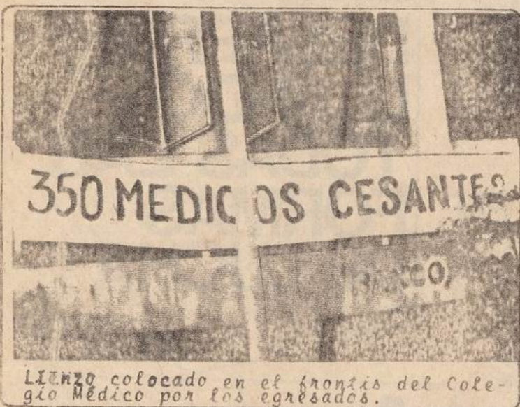
Lienzo colocado en el frontis del Colegio Médico por los egresados.

EL CONFLICTO NO HA SIDO SOLUCIONADO Y LA MOVILIZACIÓN CONTINÚA. LA DICTADURA HA BUSCADO CONTENERLA MEDIANTE LA OCUPACIÓN OFRECIDA A LOS MÉDICOS CESANTES A NIVEL DE LAS COMUNAS, QUE NO ES OTRA COSA QUE EL EMPLEO MÍNIMO PARA LOS MÉDICOS, CON SUELDOS MISERABLES Y ESCASOS O CASI NULOS RECURSOS DE TRABAJO Y ASISTENCIAS.