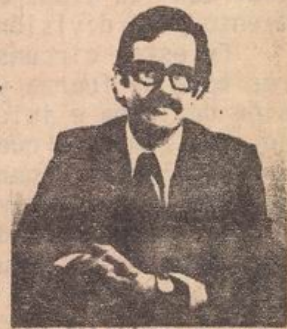
ANDRES PASCAL ALLENDE

El Secretario General del MIR, Andrés Pascal Allende, llegó a Nicaragua el 22 de noviembre para sostener una serie de entrevistas con dirigentes del Frente Sandinista de Liberación Nacional (FSLN). El máximo dirigente del MIR fue recibido, a su llegada, por el Ministro del Interior y miembro de la dirección nacional del FSLN, comandante Tomás Borge Martínez . Durante su permanencia en Nicaragua el Secretario General del MIR se abocó a difundir los avances de la lucha de la Resistencia Popular chilena que cuenta con el apoyo decidido del pueblo nicaragüense y de su gobierno. A la vez, este contacto le permitió interiorizarse de la marcha victoriosa de la revolución sandinista en su cuarto año de existencia. Antes de viajar a Nicaragua, Pascal Allende visitó México , Cuba , Francia , URSS , Italia , Suecia , Noruega y Finlandia , donde fue recibido por altas autoridades de esos países que le expresaron su interés y solidaridad con la lucha libertaria de la Resistencia Popular en Chile.