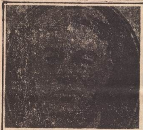
RECABARREN, PADRE DEL MOVIMIENTO OBRERO.

pojarlos de sus remuneraciones. Los despidos masivos se realizan como en MADECO y otras industrias, con presencia de carabineros armados de fusiles para respaldar al patrón.