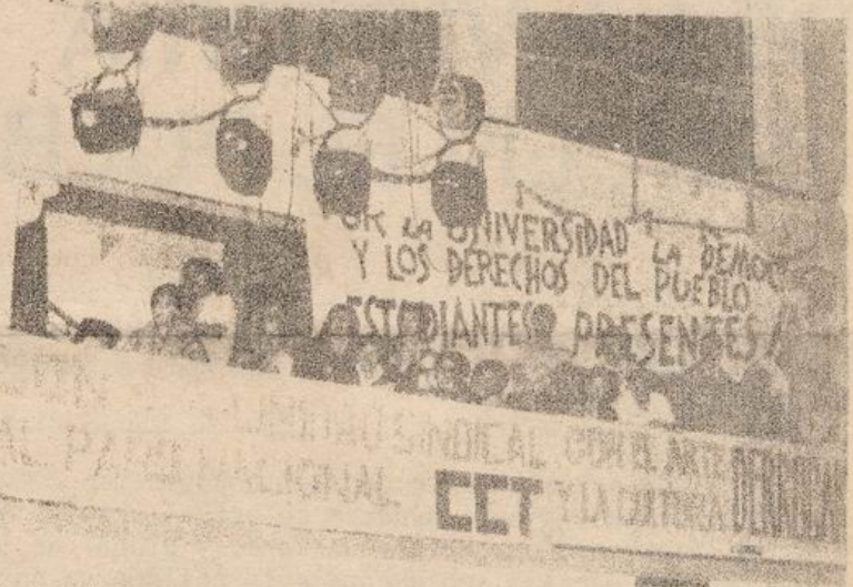
PRESENCIA DE LOS TRABAJADORES EN UNO DE LOS ACTOS MASIVOS DEL PUEBLO

* "En este momento no hay milicias entre los obreros, pero pienso que a futuro sí habrá. Dentro de los trabajadores están los de vanguardia, los de avanzada y está la masa. Los trabajadores avanzados ven la necesidad de que nos preparemos, nos organicemos militarmente y nos plantean eso a los dirigentes. Primero van a ser las brigadas de autodefensa, después puede ser la milicia cuando nos quedemos cortos con la autodefensa"