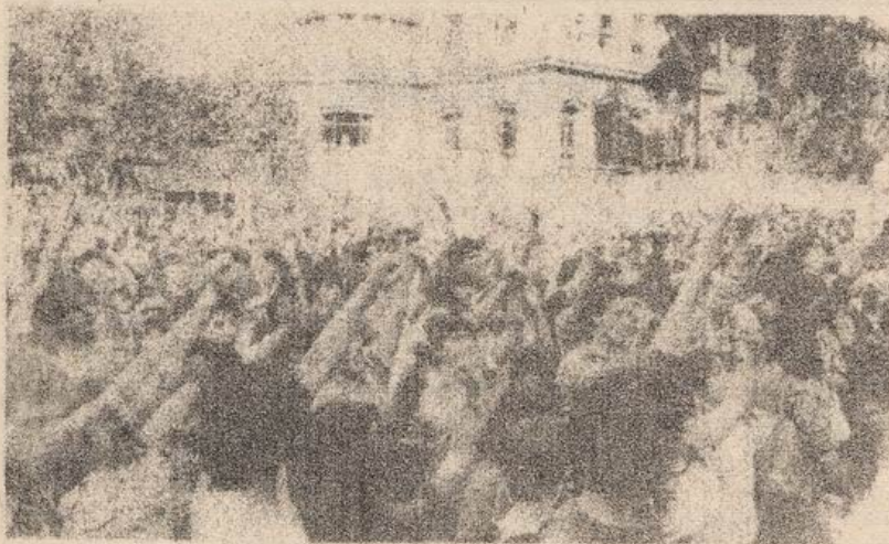
CON EL PUÑO EN ALTO, VOCEANDO CONSIGNAS EN INGENIERIA

Un promedio del 70% de los universitarios pararon sus actividades el 12 de abril en la U y UC en Santiago, y en otros establecimientos del país. El paro fue convocado para exigir la democracia en el país y en las universidades, así como el término de la represión y el fin de los rectores delegados, además de preparar las fuerzas estudiantiles para el Paro Nacional, Obrero y Popular. En Santiago, el día 12, se realizaron asambleas en casi todos los planteles de la enseñanza superior, hubo manifestaciones en el centro (con 12 detenidos), marchas en los campus Oriente y San Joaquín de la UC, y un acto central en la Facultad de Ingeniería de la U. donde participaron alumnos de todas las universidades de la capital y estudiantes secundarios. También se realizaron mítines en diversas regiones, destacando las ciudades de Concepción y Valparaíso, en la cual las manifestaciones se prolongaron hasta el anochecer, con 38 detenidos. En La Serena los estudiantes efectuaron desfiles callejeros, mientras que en la U. del Norte, en Antofagasta, 200 alumnos interrumpieron la clase magistral con que el presidente de