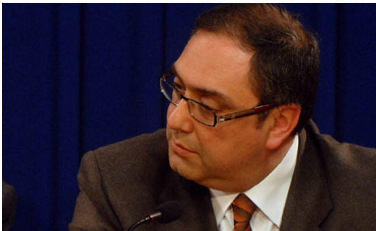
El senador independiente