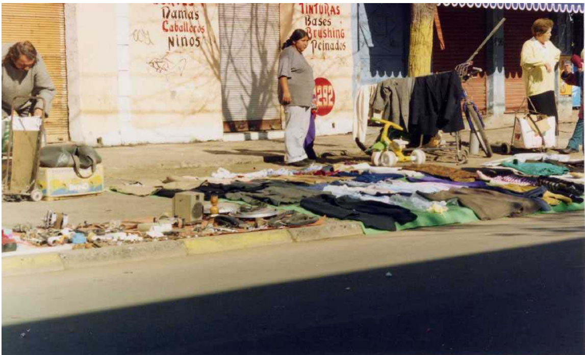
Imagen N° 1: Al lado izquierdo de la fotografía se aprecia a un hombre mayor con su puesto de “cachureos”. A la derecha, una mujer joven que combina la venta de “cachureos” con la de prendas de ropa usada.