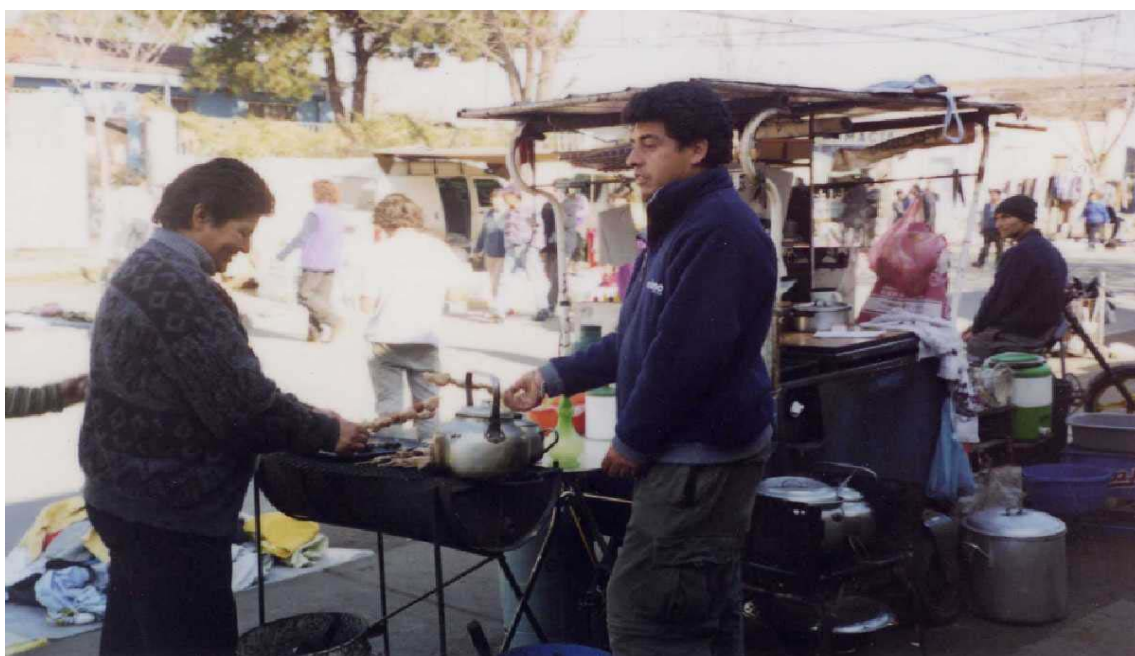
Imagen N°3: En esta fotografía se puede ver a una pareja que vende alimentos manufacturados. Cuentan con una parrilla en la que preparan anticuchos y un “carrito” en el que preparan colaciones, sopaipillas, café, etcétera.