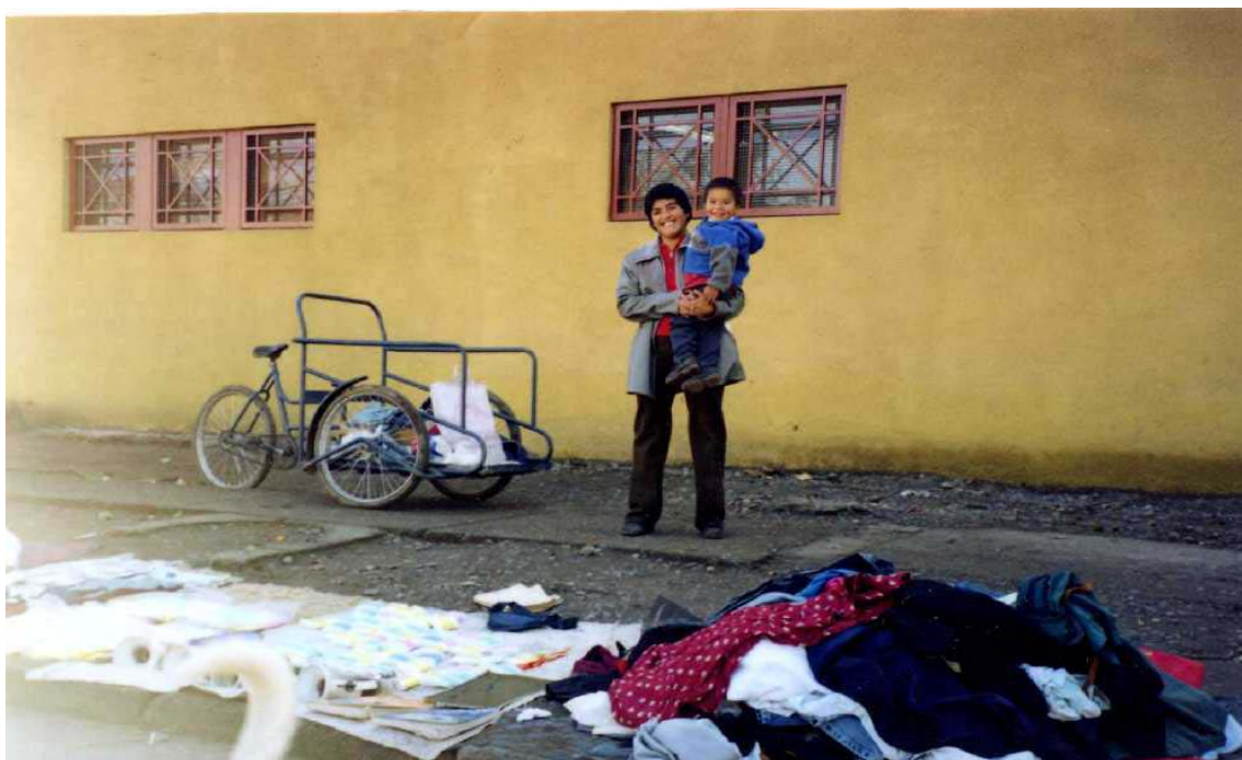
Imagen N°2: En esta fotografía se aprecia a una mujer vendiendo junto a su pequeño hijo. Ella combina la venta de ropa usada, con la de otros artículos como pañuelos, cotonetes, etcétera. Atrás se ve el triciclo con el que trabaja.