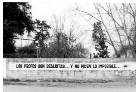
“...proyectos que hagan entusiasmarse a la juventud y a la gente”.

Siempre he entendido que ser de izquierda es tener valores (...) Ser de izquierda es sentir pasión por la justicia social, por la libertad del ser humano. Y en este país hay millones de chilenos que creen en eso; entonces, no los podemos defraudar.