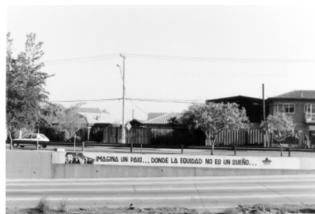
“Porque hay un país real, y el otro es imaginario”.