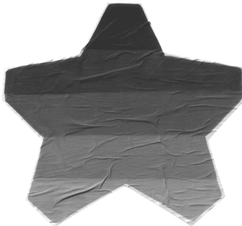
Estrella de la Brigada Chacón.