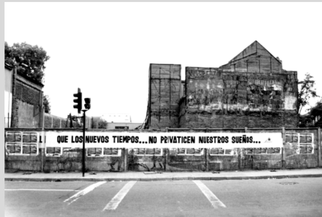
La Chacón siente que se ha ganado los muros de la ciudad.