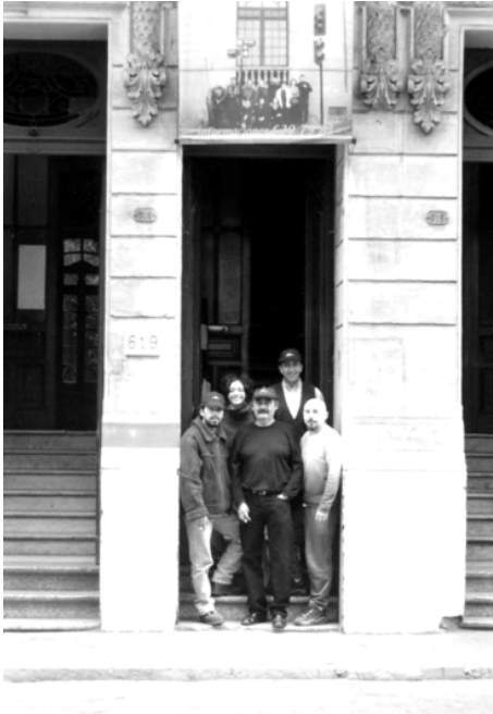
Aparte de los brigadistas estables, la Brigada cuenta con una amplia red de amigos.

desarrollo del ser humano, la libertad para emprender del ser humano; o sea, todo el mundo quiere ser empresario, todo el mundo quiere ser comerciante, se vino abajo el sindicalismo de clase, porque cambió culturalmente el país, la gente.