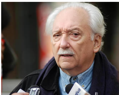
Jorge Arrate, pre candidato Presidencial del Partido Socialista

El documento afirma además que es necesario «realizar un profundo viraje en la política del país, que permita enfrentar el modelo neoliberal con un nuevo proyecto que se proponga renacionalizar las riquezas mineras de Chile y otras de significación estratégica para la soberanía nacional, como los recursos acuíferos; la energía y las telecomunicaciones».