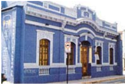
La Peña de los Parra funcionó entre los años 1965

Tras su largo viaje por Europa, Violeta Parra pasó por un buen período de creación y reconocimiento artístico. Comenzó a trabajar con sus hijos en una peña folclórica instalada por ellos en Santiago.