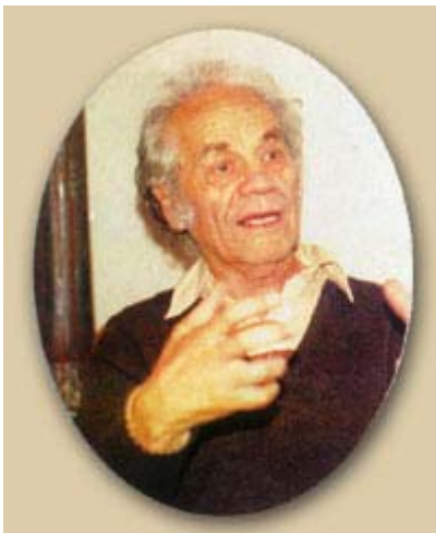
Nicanor Parra, destacado poeta y académico, hermano de Violeta