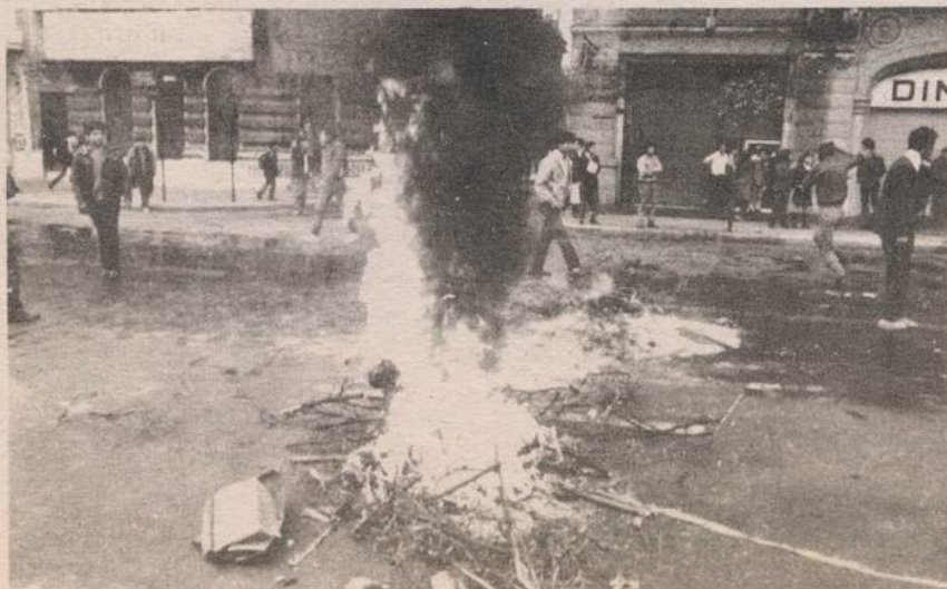
CONTRA LA DICTADURA CON TODOS LOS MEDIOS.

En el campo del movimiento popular, la izquierda sin duda que ha jugado el rol de primera fuerza política. Durante mucho tiempo ha sido el único interlocutor de la dictadura y ha conducido las movilizaciones más importantes, como fue la de septiembre del '85. Su debilidad más significativa —como lo ha sido todo este tiempo— es la carencia de una propuesta política que exponga con nitidez los intereses del pueblo; esto quedó en evidencia con la aparición del Acuerdo. La imagen más acertada que debemos tener del movimiento popular es de una fuerza en constante acumulación y mayor capacidad de enfrentamiento con el régimen. La demostración de la afirmación anterior está dada en la incorporación a la lucha de los trabajadores como fuerza de masas (Lota, Chuquicamata y los portuarios generaron una gran ola de entusiasmo); en la incorporación de los estudiantes de Enseñanza Media; los positivos procesos unitarios de fuerzas políticas, como los socialistas al interior del MDP; y, por último, el creciente despliegue de la fuerza militar propia, donde sin duda está el avance más estratégico del '85. De lograr consumarse estos procesos, no nos queda duda que el movimiento popular puede alcanzar una nueva correlación de fuerzas con el enemigo y constituirse en alternativa nacional y, por lo tanto, estar en condiciones de darle sustantivas derrotas a la dictadura y alterar el cuadro político nacional.