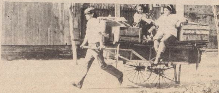
EL PUEBLO PAGA LAS CONSECUENCIAS DE LAS MEDIDAS ECONOMICAS.

Sólo los cambios los vemos dentro de la perspectiva de botar a la Dictadura y limpiar el país de estos tecnócratas y sus recetas de Chicago. Por mientras, en esta perspectiva debemos buscar soluciones de manera directa a nuestros problemas de pan, techo y abrigo.