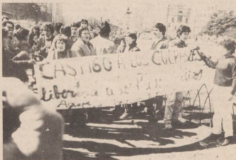
HASTA QUE QUEDEN TODOS LIBRES...

No fue nada sorprendente ni significativo, ya que nadie lo comentó después, y pasó sin pena ni gloria. Solamente los lolo que estaban en las esquinas se dieron cuenta de las "lindas piernas" de la alcaldesa y los piropos iban y venían.