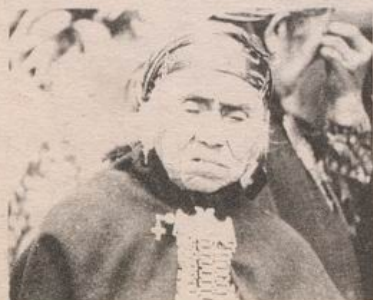
EL PUEBLO MAPUCHE SE PONE DE PIE.

Un nuevo repunte ha tenido la organización Mapuche en lo que es su histórica lucha por recuperar la tierra de la cual fueron despojados. En los últimos días los dirigentes del Ad-Mapu se han preocupado de dar a conocer sus problemas y hacer conciencia sobre el resto de la sociedad sobre su situación. Y, a comienzos de año ya, los caciques de la zona del Bío Bío se organizaban para levantar sus demandas frente a las autoridades regionales.