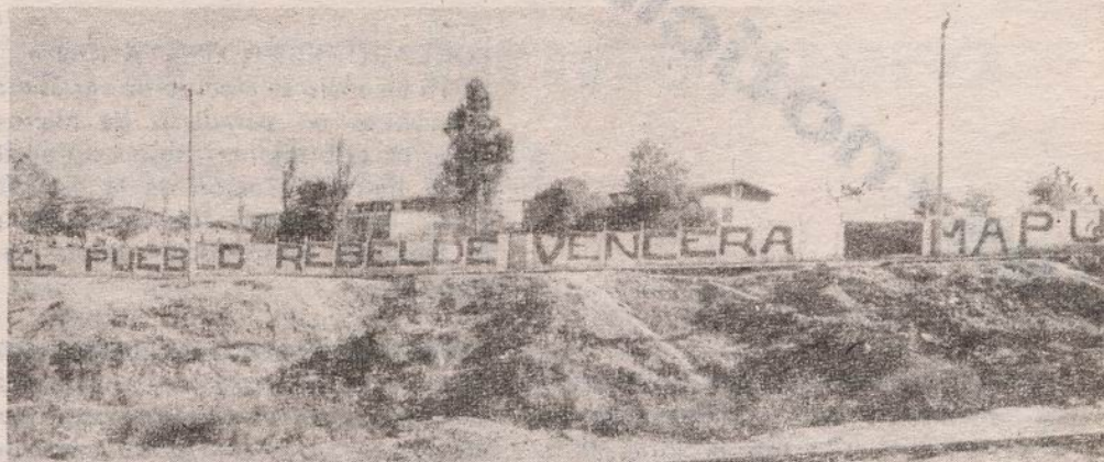
FOTO 2: Las sofisticadas armas de la Dictadura jamás podrán acallar el clamor del pueblo que se agiganta en cada muestra de concertación y unidad.

FOTO 1: La propaganda es el medio privilegiado de comunicación de las masas. Es una muestra de osadía, de valentía, pero es un deber revolucionario.